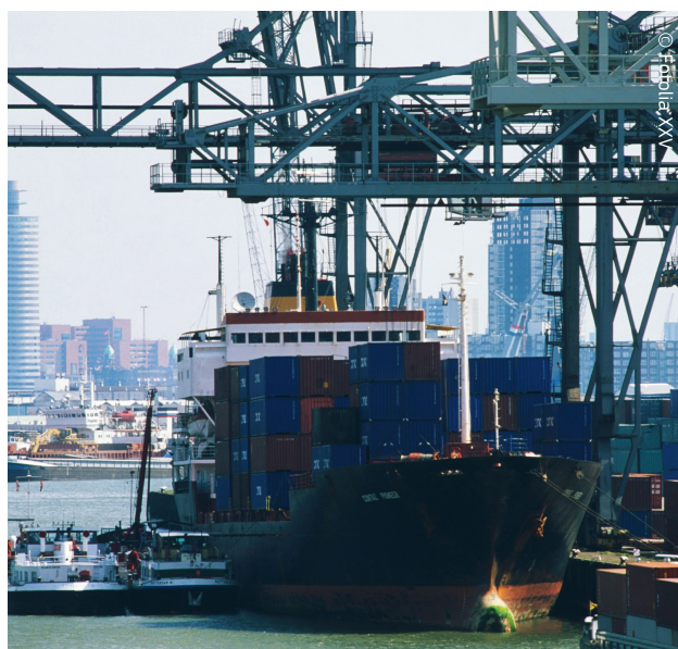
Portul Rotterdam: cea mai mare poartă comercială din Europa.

În același timp, politica fiscală europeană are ca scop facilitarea liberei circulații a persoanelor, bunurilor, serviciilor și capitalului. Comisia Europeană va continua să depună eforturi în vederea eliminării obstacolelor fiscale din calea liberului schimb în Europa și în lume. Ea va continua să ajute țările membre să se dezvolte și să prospere.