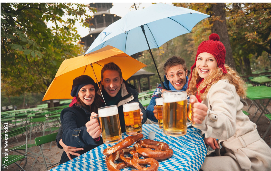
Ce se vede: patru prieteni la o bere, într-o grădină din München. Ce nu se vede: UE încurajează comerțul echitabil prin armonizarea accizelor la bere.

Legislația în domeniul impozitării directe se limitează la alinierea legislațiilor țărilor UE pentru a le aduce în concordanță unele cu altele (apropierea legislațiilor). Acest lucru poate fi realizat numai în măsura în care este necesar pentru a îmbunătăți funcționarea pieței interne a Uniunii Europene și pentru a aborda provocările transfrontaliere comune, cum ar fi evaziunea fiscală.